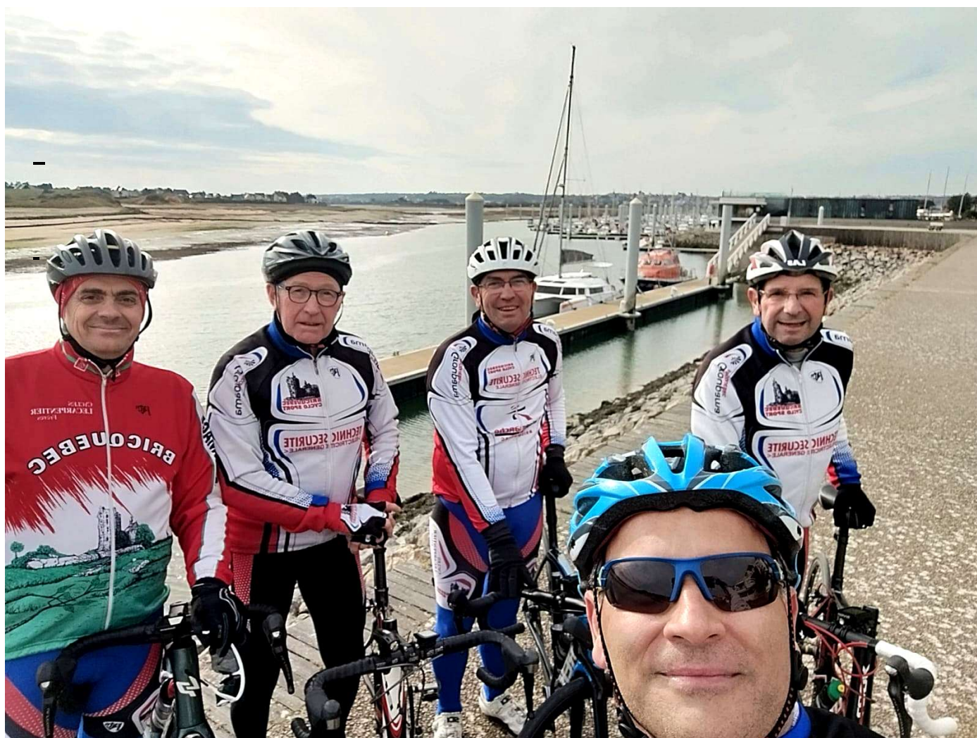
PAUSE A CARTERET