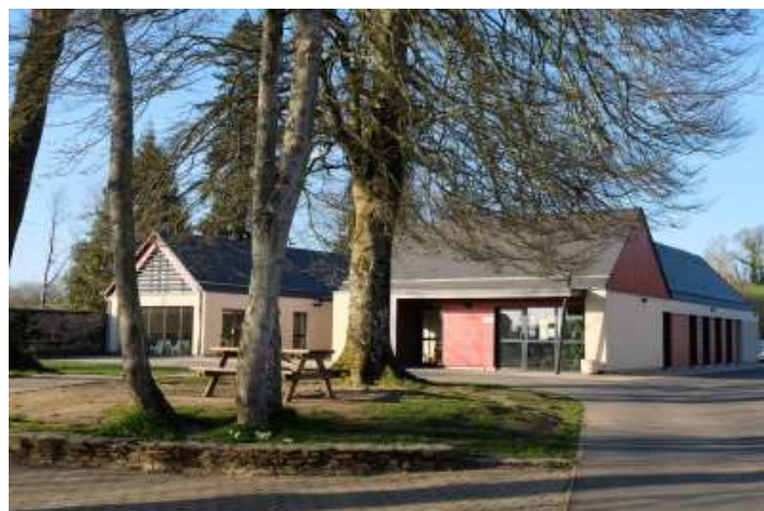
Hébergement à la MFR de BALLEROY

Photos «3 jours » des 20,21 et 22 juin 2025