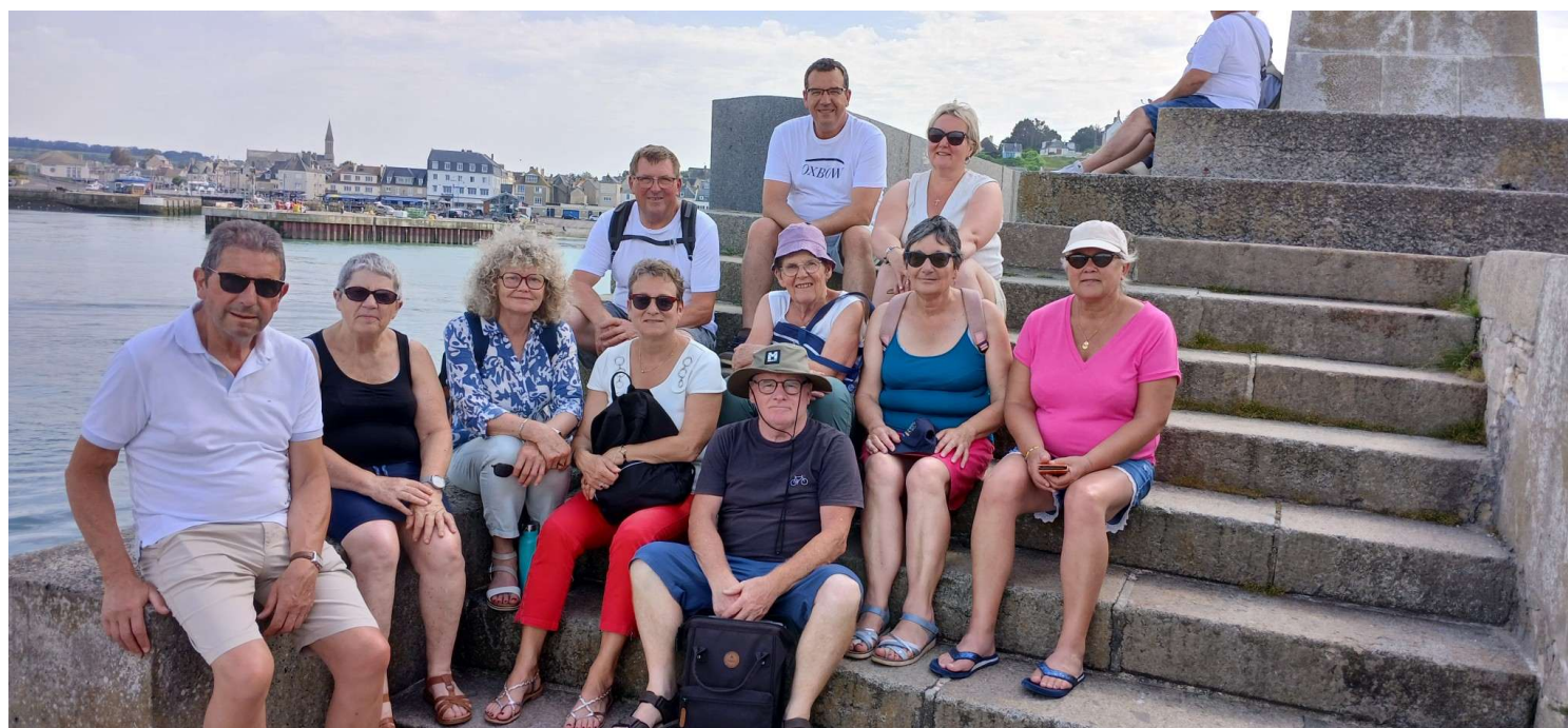
Rafraîchissement à Port en Bessin après les sorties à Balleroy sous la canicule, 35°...